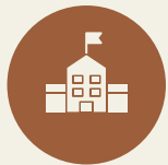
學校與農田受損，生活困難