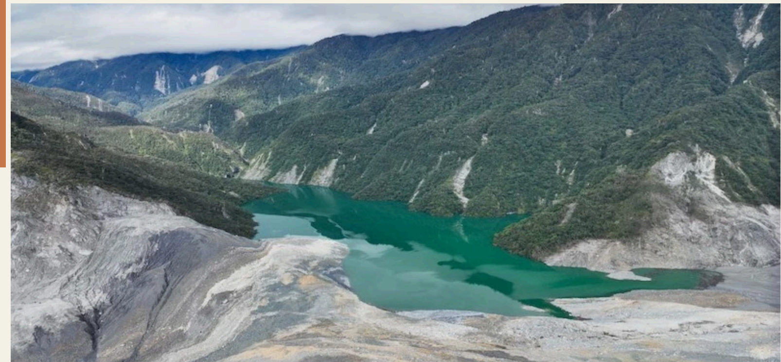
9月6日馬太鞍溪堰塞湖空拍影像。